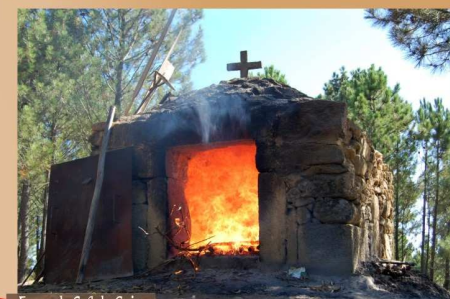
Forno da Sr.ª da Guia

A Nossa Senhora da Guia está sempre presente na reconstituição da romaria "Milagre d'Urgueira". Seja no alto das 3 colunas de granito, na entrada do parque, a saudar todos os que chegam, seja no repouso da sua ermida, ou na viagem anual que realiza e dá uma volta ao forno, pousada nos ombros das mulheres da Urgueira. Estas, tal como a Sr.ª da Guia, ainda resistem ao abandono e à desertificação da serra, ficando para que a Urgueira viva e a tradição reviva com ela.